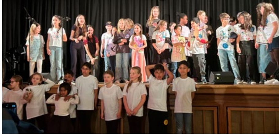
Kooperationsprojekt „ICH bin ICH“

Im Projekt „Fremd bin ich hierher gekommen“ gab und gibt es Lesungen aus dem Buch „Fremd bin ich hierher gekommen“ mit Interviews und Porträts sowie anschließenden Workshops. Eine dazugehörige Wanderausstellung „Fremd bin ich hierher gekommen – junge Geflüchtete in 25 Portraits“ kann ausgeliehen und aufgestellt werden. Kooperationspartner sind das Kommunale Integrationszentrum Wuppertal, das WUPPER THEATER e. V., die Stadtbibliothek Wuppertal und das Von der Heydt-Museum Wuppertal. Viele Schulklassen wurden bereits eingebunden.