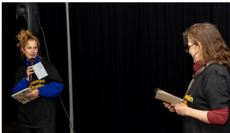
Moderation bei #ChanceKultur3