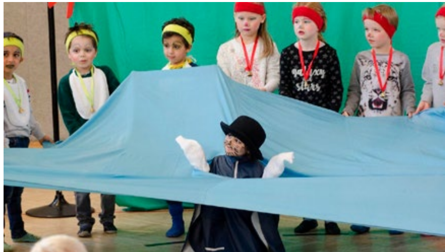
Theaterstück „Der schlaue Wolf“

Seit über 33 Jahren gibt es das interkulturelle Wuppertheater, das bei einem Festtag 2024 in der Alten Feuerwache zeigte, wie es künstlerisch auf der Bühne und in Workshops zur Verständigung zwischen Kulturen beiträgt. HÖHLE heißt ein soziokulturelles Projekt mit integrativem Charakter, ein Musikabenteuer und Forschungslabor für innovative Frühpädagogik, das Kinder von ein bis fünf Jahren und deren Familien an unterschiedliche Orte in der Stadt einlädt. Mit seinem Flyer in sechs verschiedenen Sprachen hat es Menschen ganz unterschiedlicher Hintergründe angesprochen. Projektträger ist das soziokulturelle Kommunikationszentrum LOCH Wuppertal.