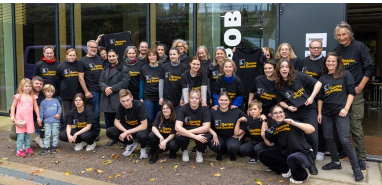
Gruppenfoto der Besucher* innen von #ChanceKultur3

Zu Schule und Kultureller Bildung: Wie kann das System Schule noch mehr für die Kulturelle Bildung geöffnet werden? Wie können Kooperationen von Schulen und externen Kulturschaffenden sowie mit Kultureinrichtungen aussehen? Wer kommt finanziell für Angebote der Kulturellen Bildung in Schulen auf? Wie können kulturelle Partner in den Schulalltag eingebunden werden? Wie können kulturelle Angebote in der Grundschule fest installiert werden? Wie entsteht mehr Kontakt zum Stadtbetrieb Schulen? Wie kann das Netzwerk für Kulturelle Bildung von Stadt und Politik unterstützt werden? Wo können Schulprojekte auf die Bühne gebracht werden?