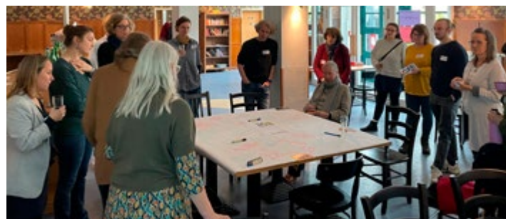
Forschungs- labor

Mit dem Projekt HÖHLE des Soziokulturellen Zentrums LOCH bereichern neue Player die frühkindliche Kulturelle Bildung und befördern mit einem Netzwerkaufbau zum Thema den Austausch zwischen den verschiedenen Stakeholdern.