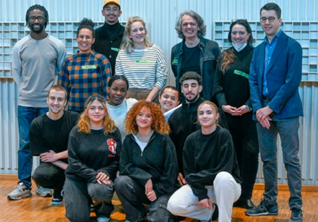
Gruppenbild der Veranstaltung #ChanceKultur2

Die im Film Mitwirkenden betonen die identitäts- und persönlichkeitsstiftende Funktion Kultureller Bildung und lassen die Sinnhaftigkeit und Selbstwirksamkeit, die junge Menschen durch Kunst erleben, erfahrbar werden. Zugleich werden Wünsche und Anliegen von Jugendlichen in Bezug auf konkrete kulturelle Bildungsangebote deutlich. Diese werden als Anregung im Prozess der Weiterentwicklung der Kulturellen Bildung aufgegriffen.