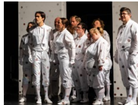
POUR Ensemble

Die inklusive Theatergruppe Bamboo ist mit jährlichen Stückentwicklungen und Aufführungen seit 15 Jahren in der Färberei in Oberbarmen aktiv.