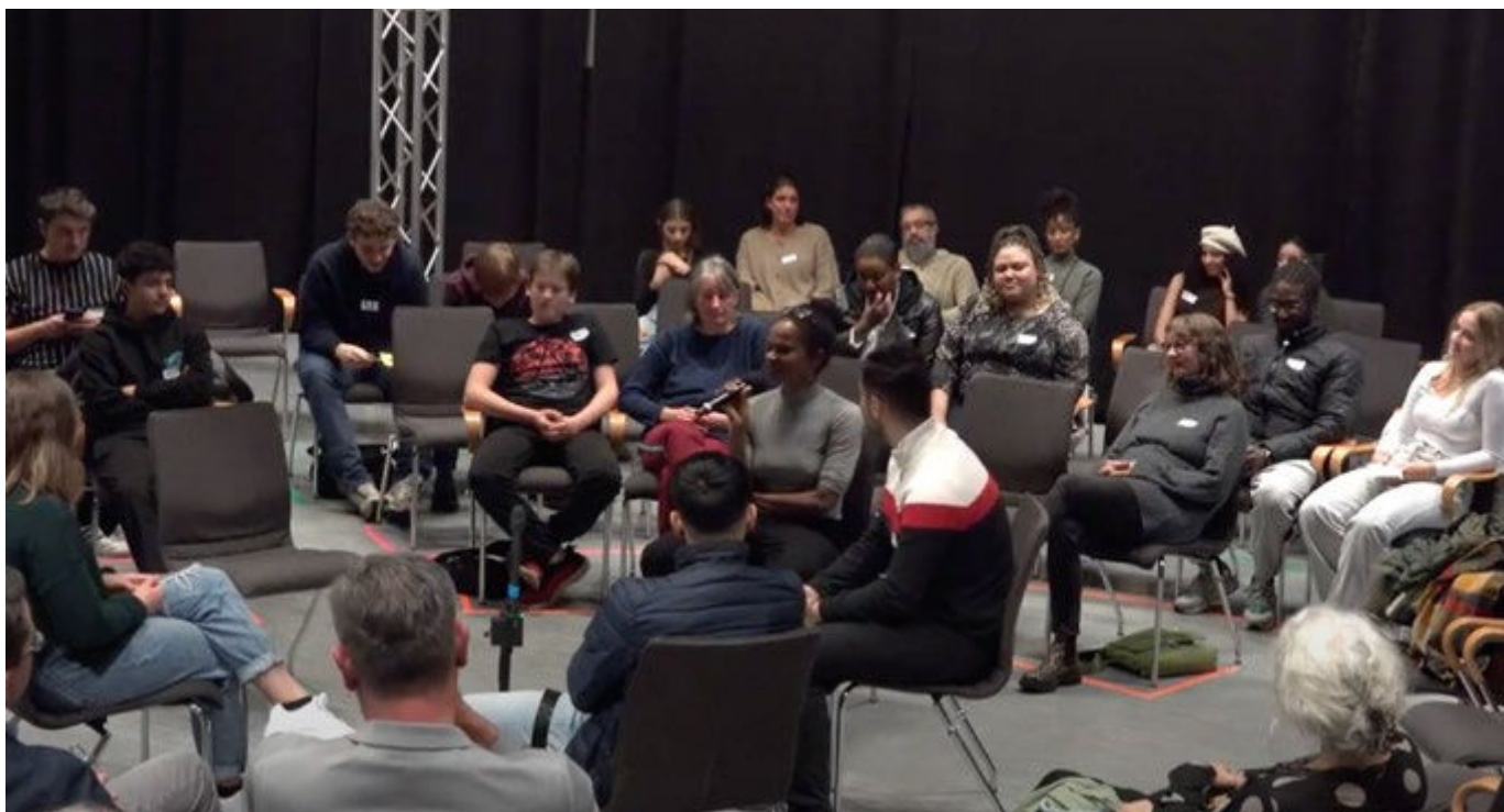
Fishbowl Diskussion September 2022 Screenshot

Zur Filmpremierre im September 2022 kamen erstmals alle 50 Teilnehmenden zu einem gemeinsamen Austausch zusammen. In diesem Rahmen konnten sie mit Wuppertaler Politiker*innen, Lehrkräften, Jugendeinrichtungen, Künstler*innen und anderen Tätigen der Kulturellen Bildung ihre Anliegen und Ideen im Rahmen einer Fishbowl-Diskussion auf Augenhöhe besprechen. Die Gäste zeigten in diesem konzentrierten Gesprächsformat großen Respekt vor den Schilderungen und Perspektiven der jungen Menschen. Neben den oben bereits aufgeführten Punkten wurde u. a. deutlich, dass junge Menschen mehr Möglichkeiten zur Mitsprache im Bereich Kultureller Bildung brauchen. Weitere Themen waren u. a.: Diversität sowie die Unterstützung marginalisierter Gruppen in und durch Kulturelle Bildung, der Wunsch nach stärkerer Professionalisierung in der Kunstvermittlung sowie die Perspektive, Kulturelle Bildung als berufsorientierende Maßnahme für kreative und künstlerische Berufe anzuerkennen.