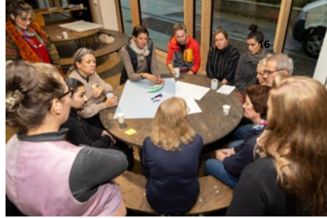
Arbeitsstisch bei #ChanceKultur3