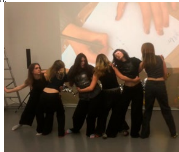
Performance Knoten

Seit 2018 gibt es den KulturCampus Wuppertal, ein Projekt der Bergischen Universität Wuppertal , das Universität und die Kulturszene vernetzt. In den letzten Jahren wurde der KulturCampus Wuppertal neu aufgestellt und aktiviert. Hier haben Studierende die Möglichkeit, ein eigenes kulturelles Projekt zu entwickeln und durchzuführen. So entstehen nicht nur Kontakte zur Kulturszene, sondern es wird über Studierende der Nachwuchs in der Kulturellen Bildung im Bergischen Land gefördert und angeregt, indem Studierende Kompetenzen in der kulturellen Projektarbeit aufbauen. In der Kunsthalle Barmen fand ein Workshop mit Schüler*innen statt, aus dem eine Performance zum Thema „Knoten“ und Identitätsbildung entstand, die in einer Ausstellung gezeigt wurde. Mit der KulTour besuchen junge Menschen Kulturorte der Stadt und kommen dabei in einen Austausch. So bringt der KulturCampus die Kulturszene auf den Berg und die Uni ins Tal.