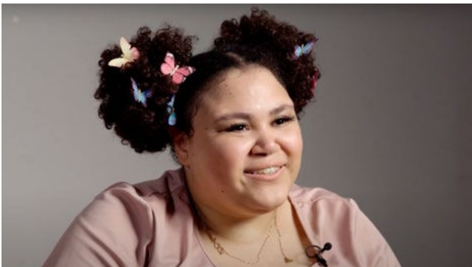
Warum wir Kunst machen – Screenshot

Im Sommer 2022 drehten das Medienprojekt Wuppertal und Akteur*innen der Kulturellen Bildung im Rahmen der Veranstaltungsreihe #ChanceKultur2 einen Film, in dem Kinder und Jugendliche als Zielgruppe der Kulturellen Bildung in Wuppertal und als junge Kreative selbst zu Wort kommen. Sie erklären, „Warum wir Kunst machen“ 5 , so auch der Titel der 40-minütigen Dokumentation, und gewähren darüber hinaus Einblicke in ihre Kunst und ihren Schaffensprozess. Die Portraitierten stammen aus bestehenden Netzwerken der Kulturellen Bildung und spiegeln eine große Bandbreite verschiedener Künste wider (u. a. Theater, Film, Tanz, Musik, bildende Kunst, Graffiti). Der Film zeigt authentische Erfahrungen Kultureller Bildung und macht die außerordentliche Bedeutung Kultureller Bildung für die Persönlichkeitsentwicklung junger Menschen erfahrbar. Über den YouTube Kanal des Medienprojekts Wuppertal ist er online einsehbar. 5