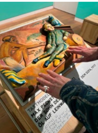
Tastmodell zu einem Gemälde von Max Pechstein

Das Von der Heydt-Museum bietet Führungen für sehbehinderte und blinde Menschen an und hat für eine möglichst barrierearme und inklusive Vermittlung für alle Besuchenden erstmals ein großes Tastmodell zu einem Gemälde von Max Pechstein in der Ausstellung installiert. In den Wuppertaler Bühnen gibt es zudem ein spezielles Programm für Gehörlose .