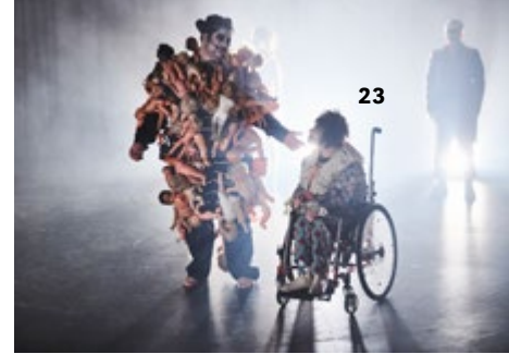
Inklusives Studio „Draußen vor der Tür“

Uwe Schinkel – Fotograf und Kulturmanager, GLANZSTOFF Akademie der inklusiven Künste e.V.