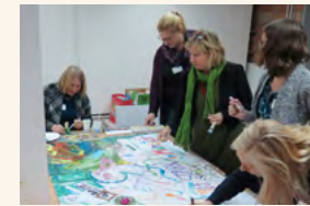
Infotag in Münster

Fünf Veranstaltungen der Servicestelle „Kultur macht stark“ NRW informierten im Herbst 2018 über das Förderprogramm „Kultur macht stark. Bündnisse für Bildung“. Insgesamt 420 Interessenten nahmen an den Infotagen in Gelsenkirchen, Bielefeld, Münster, Köln und Lüdenscheid teil. Die hohe Resonanz zeigt das große